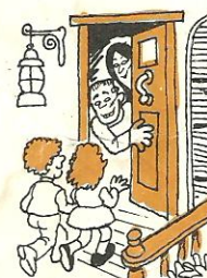
a la casa de mis tíos

As you can see, a means "to." When a is used with el ("the," masculine singular), the two join together to make al : el hotel the hotel Voy al hotel. I'm going to the hotel.